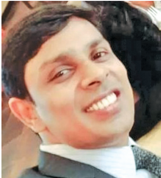
පා.ම. අර්ථනා රාමනාදන්

ප්‍රසිද්ධ නොවැ 14 දින පැවැත්වූ මහමැතිවරණයෙන් යාපන දිස්ත්‍රික්කයෙන් මනාප ඡන්ද 24000 ක් ලබා පත්වූ ස්වාධීන මන්ත්‍රීවරයා, අර්ථනා රාමනාදන් පසුගිය 21 වෙනිදින පාර්ලිමේන්තු සභා ග්‍රහණයේ විපක්ෂ නායක ප්‍රධාන වාඩිලා ගැනීම ඇතුළු තවත් ක්‍රියාවන් හා කළ ප්‍රකාශ ගැන ආන්දෝලනාත්මක කතිකාවන් බොහෝමයක් මාධ්‍ය තුළ ලියැවෙමින් තිබේ.